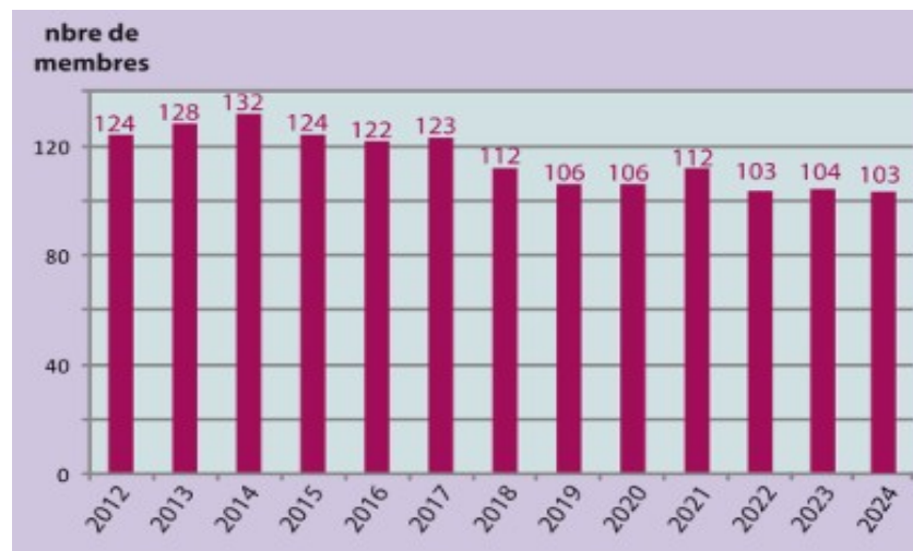
Evolution des effectifs de l'AIDA depuis 2012

L'association compte 103 sociétaires au mois d'avril 2024. Ce chiffre inclut 10 nouveaux membres dont les adhésions seront soumises à l'approbation de l'AG du 03 mai 2024. Si le nombre de nos membres a marqué il y a quelques années un recul assez net, cette baisse semble stoppée avec des effectifs se situant désormais un peu au-dessus d'une centaine d'artistes. La caractéristique principale de l'évolution de ces deux dernières années est le nombre relativement important de nouveaux membres comparé aux admissions des années précédentes. Si bien que l'on peut dire que c'est grâce à cet apport que nos effectifs se maintiennent. Cette évolution fait apparaître par la même occasion une dynamique de renouvellement de nos effectifs. Cela permet de porter une nouvelle fois l'attention sur la nécessité de veiller à la qualité de l'accueil réservé à nos nouveaux membres, afin qu'ils aient l'opportunité de bien mesurer les possibilités qui leur sont proposées.